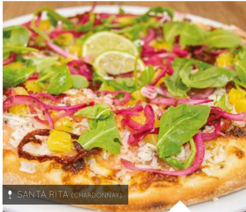
🍷 SANTA RITA (CHARDONNAY)

Finas capas de lomo de res, arúgula, cebollita crunch, parmesano flakes y aceite de trufa. B/. 14.99