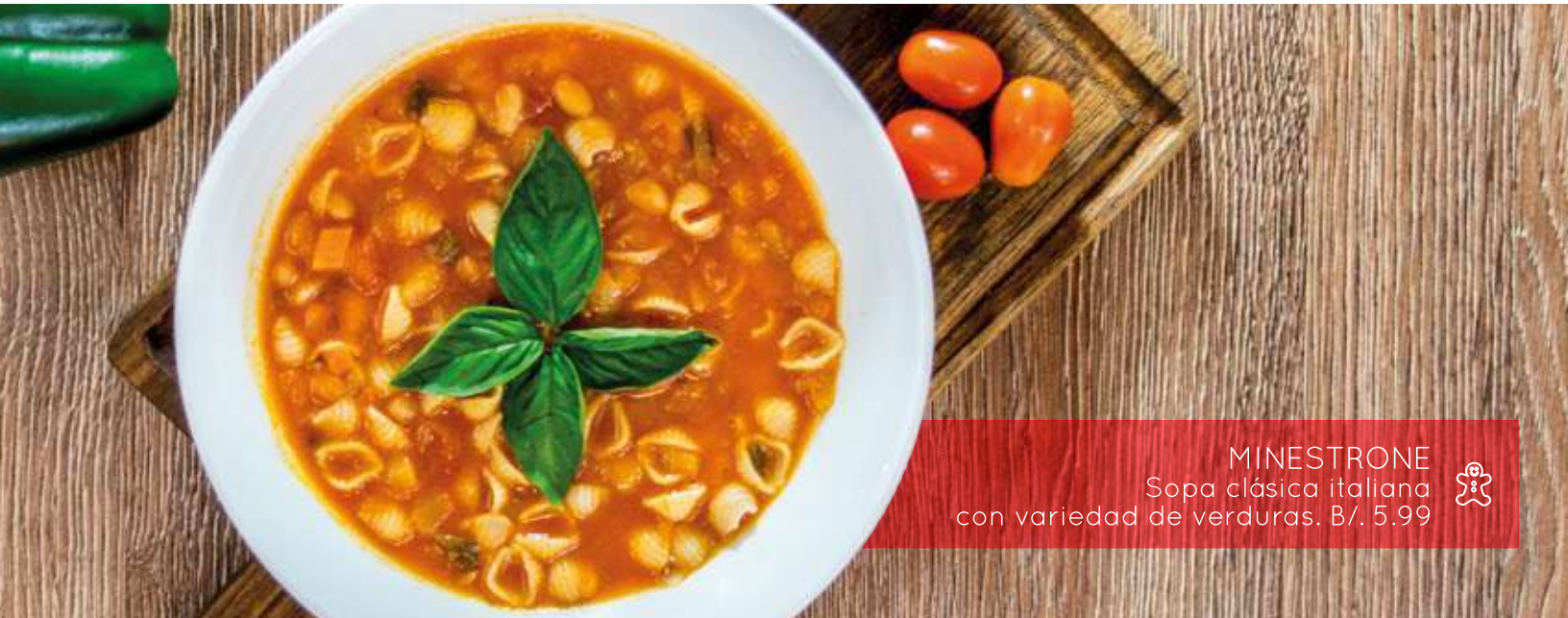
MINISTRONE Sopa clásica italiana con variedad de verduras. B/. 5.99