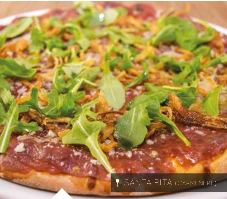
🍷 SANTA RITA (CARMENERE)

Todas nuestras pizzas pueden ser elaboradas con masa integral y gluten free.