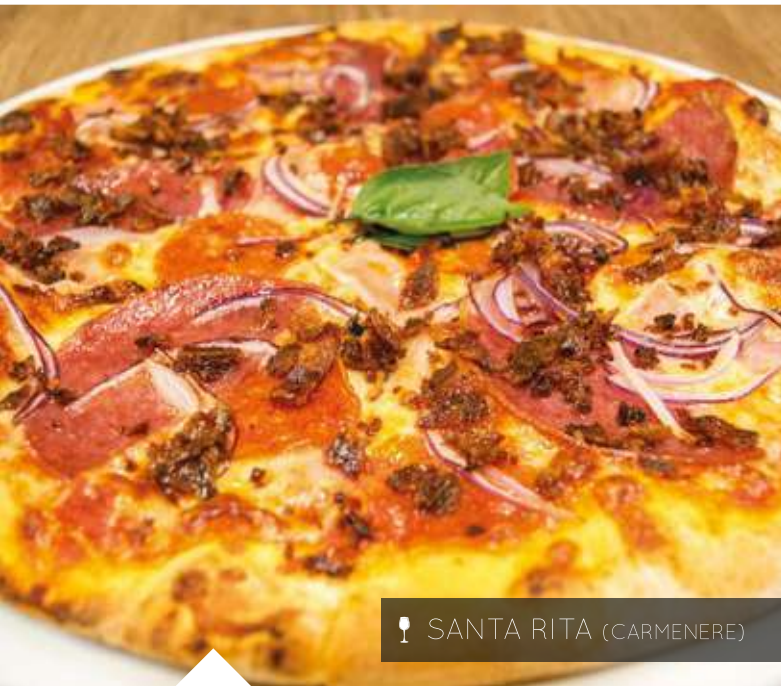
🍷 SANTA RITA (CARMENERE)

En salsa alfredo, un delicioso carpaccio de salmón con piñas marinadas en chimichurri, tomates deshidratados, arúgula, parmesano y las mejores cebollitas cítricas del mundo. B/. 15.99